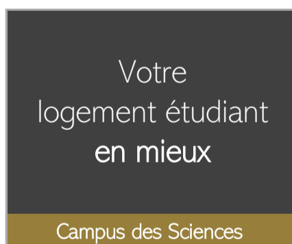
Campus des Sciences