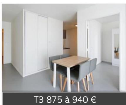
T3 875 à 940 €