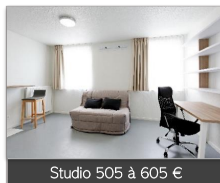
Studio 505 à 605 €