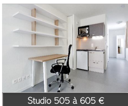
Studio 505 à 605 €